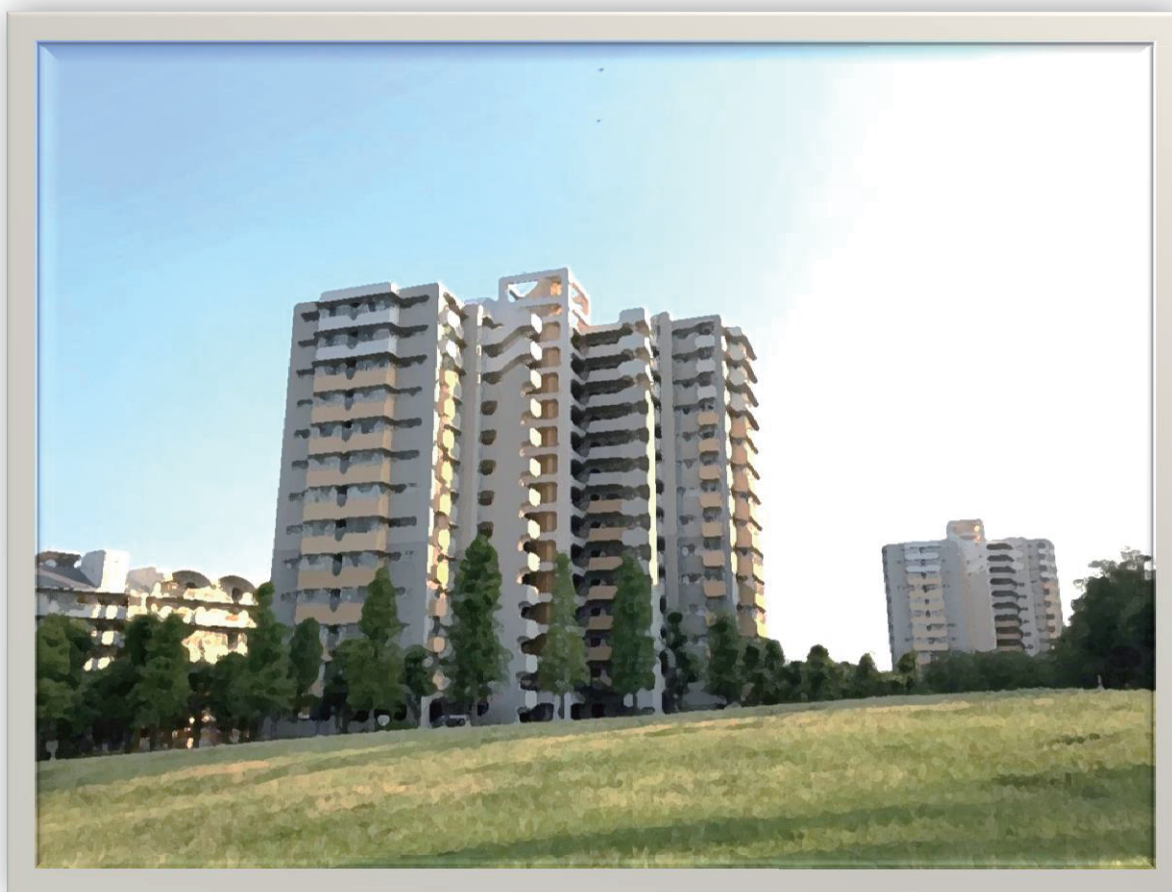
三番街風景①（撮影場所：芝生広場）

このページ他への画像（写真、絵画等、長峰と周辺にかかわるもの）を募集しています。