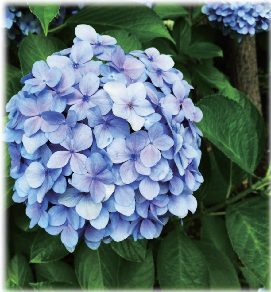
アジサイ（紫陽花） 撮影地：1、2号棟間の駐車場入口付近