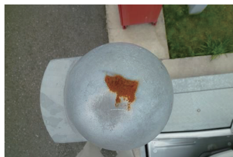
(A列操作ポール No. 1)

機械式駐車装置A列及びB列には各10本合計20本の操作ポールがあります。巡視によりそのうち13本の操作ポールの頭頂部にさびが発生していることが判明しました。さびの広がり、大きいものが7本、小さいものが6本です。さびの発生原因を納入業者のIHI扶桑エンジニアリング(株)に確認すると共に、対策を協議し対応いたします。