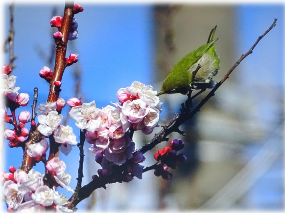
めじろ スズメ目メジロ科 撮影地 中央公園

メジロは昔から春を告げる鳥として親しまれてきた。よくウグイスと間違えられる小鳥。ウグイスと比べ、比較的警戒心がゆるいメジロは、街路樹などの甘い花の蜜を好み、ウグイスは虫や木の実を好む。また「目白押し」の慣用句があるように、枝にびったりと並ぶ習性がある。ウグイスは藪の中などにかくれ、めったに姿をみせない。