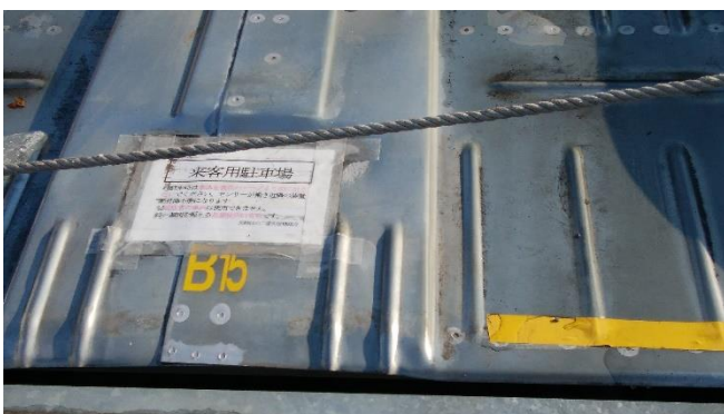
駐車パレット前部