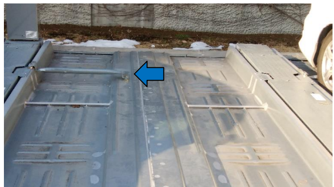
駐車パレット後方（奥）の車止め