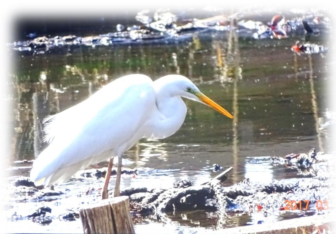
しらさぎ コウノトリ目サギ科