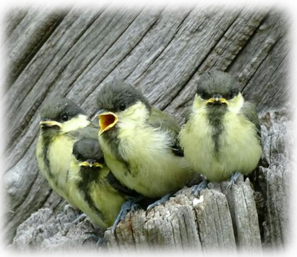
シジュウカラ雛（四十雀・スズメ目シジュウカラ科）